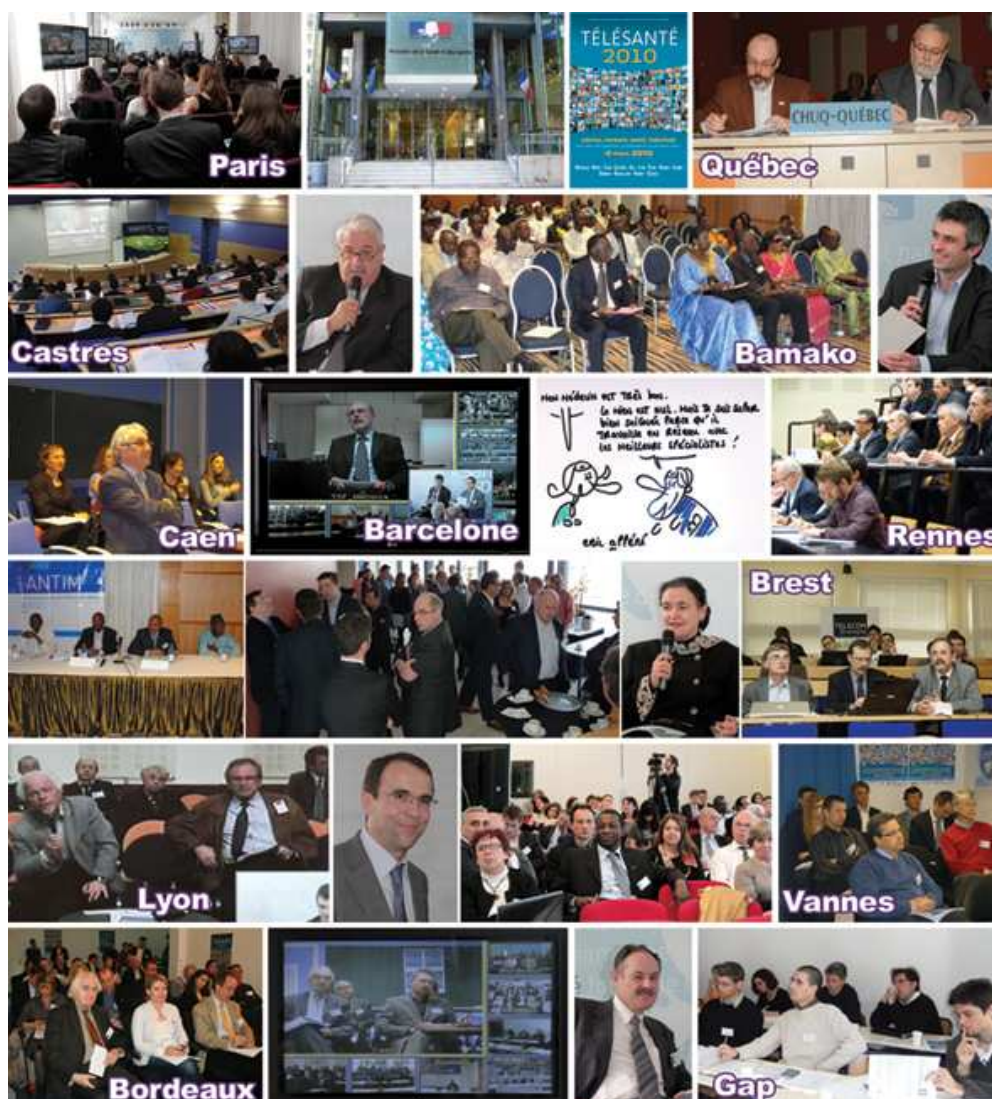
Photos prises lors de TELESANTE 2010

LE RENDEZ-VOUS INTERACTIF ANNUEL DES ACTEURS DE LA TELESANTE